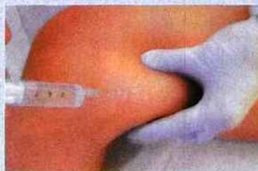
▲ Le produit injecté liquéfie les amas graisseux en profondeur.

sées de sérum physiologique, d'eau distillée et d'un anesthésiant, dont l'action mécanique fait éclater la cellule graisseuse. Injections combinées avec Médisculpt pour regalber la silhouette : infrarouges + électrostimulation. Prévoir 5 séances d'injections et 7 séances Médisculpt à partir de 100 € chaque. Tél. : 0 820 202 202.