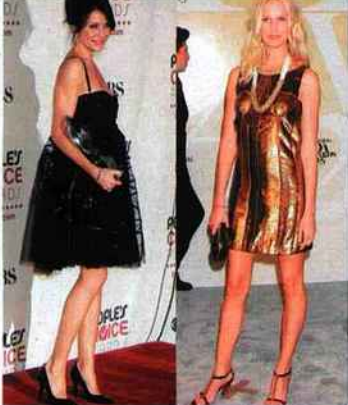
Les plus en vue Cameron Diaz.