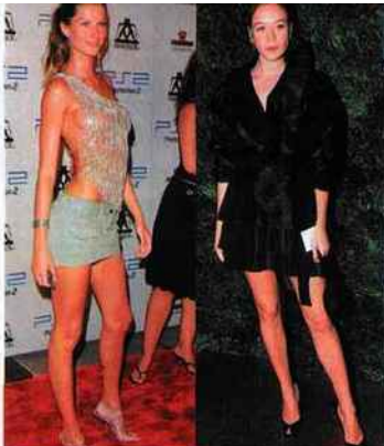
Les plus sculpturales Gisele Bündchen.